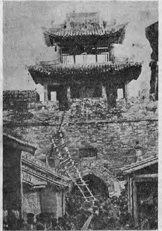
Una de las entradas a la ciudad de Nanking, por el sur, por la que los ejércitos japoneses al mando del general Iwane Matsui se lanzaron contra la capital china, la que quedó anoche totalmente ocupada.