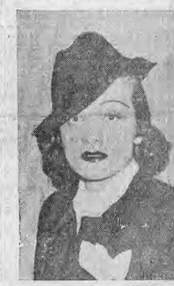
Marlene Dietrich, la afamada estrella de la pantalla, retratada a su llegada a Nueva York, a bordo del gran trasatlántico "Normandie".