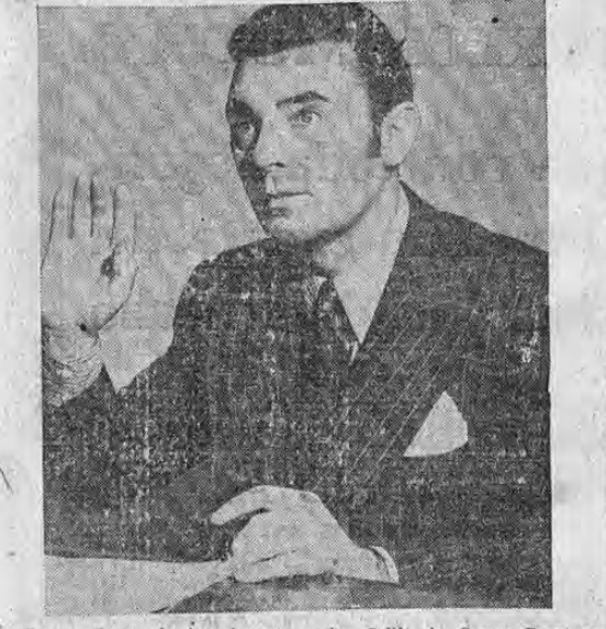
George Brent el afamado actor cinematográfico nativo de Irlanda, presta el juramento que le hace ciudadano americano, en Los Angeles, California. George Brent reconoce oficialmente su verdadero nombre que es George Nolan.